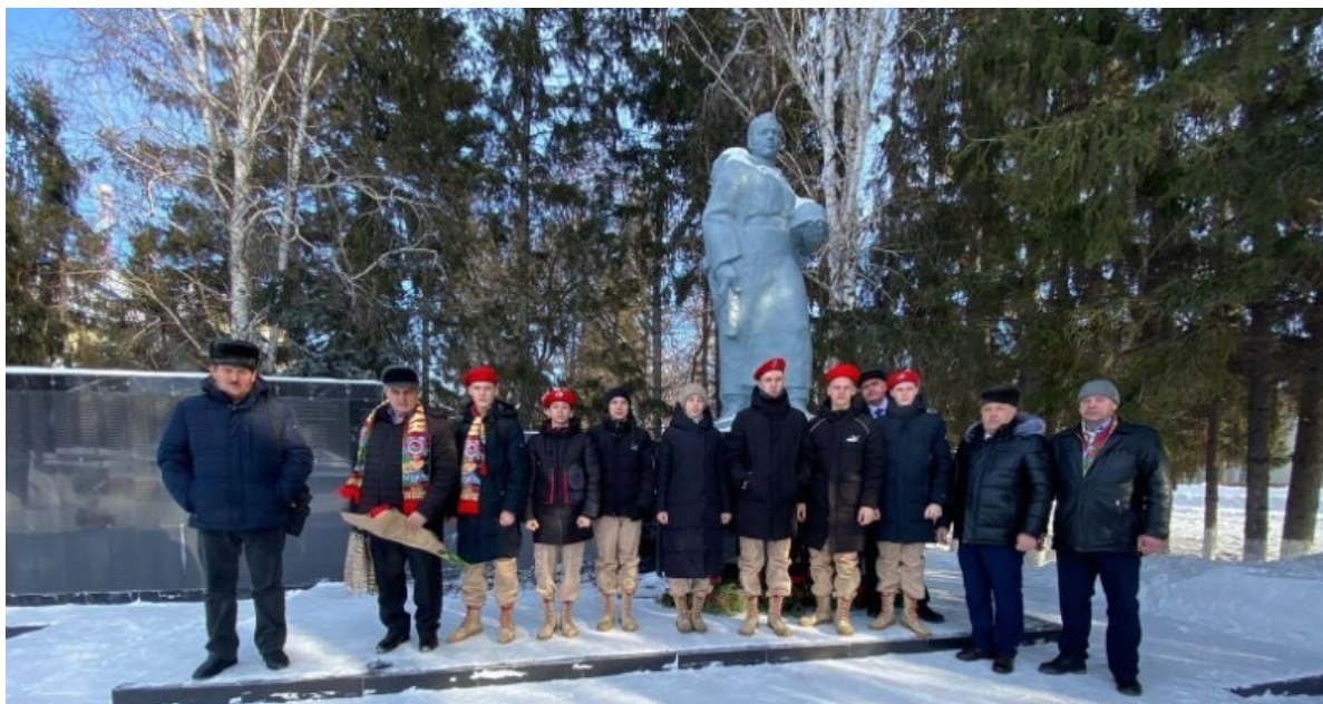
В конце мероприятия были возложена гирлянда к памятнику воину-освободителю.