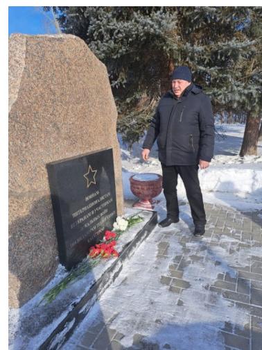
Цветы к памятнику воинам-интернационалистам, который был установлен в 2023 году.