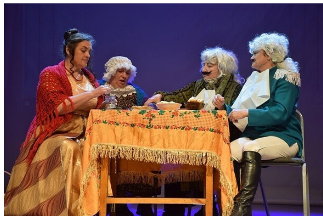
Сказка о царе Салтане". Ветераны ЦРБ.