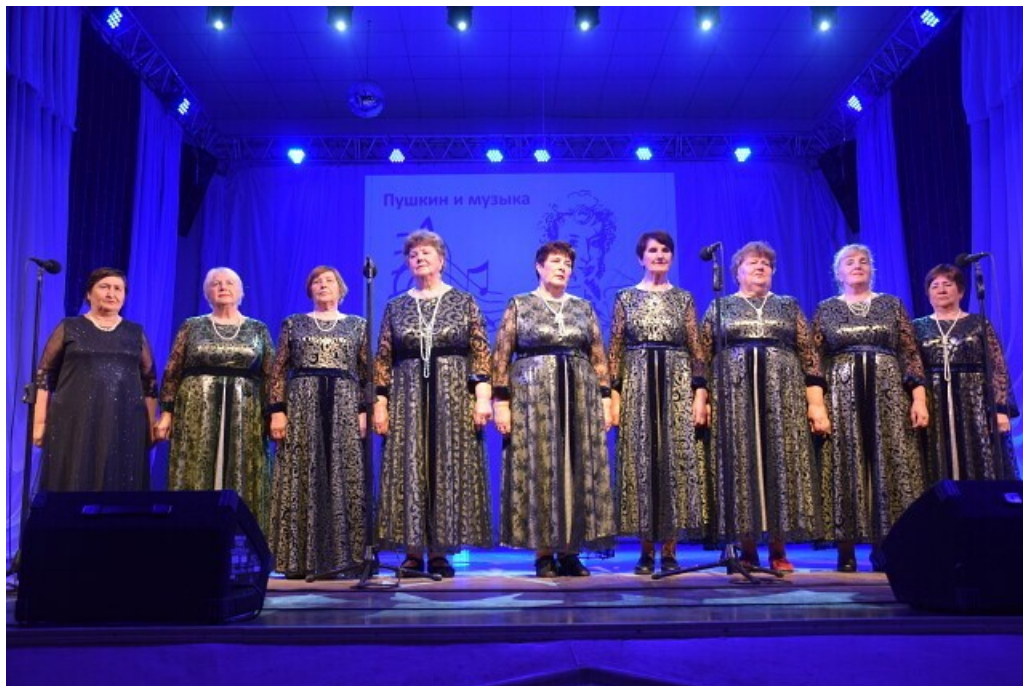
Ансамбль "Рябинушка". Ветераны села Шипицино исполняют "Зимний вечер".