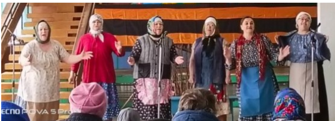
Ветераны Старокарасукского сельского поселения подготовили для земляков интересную программу.