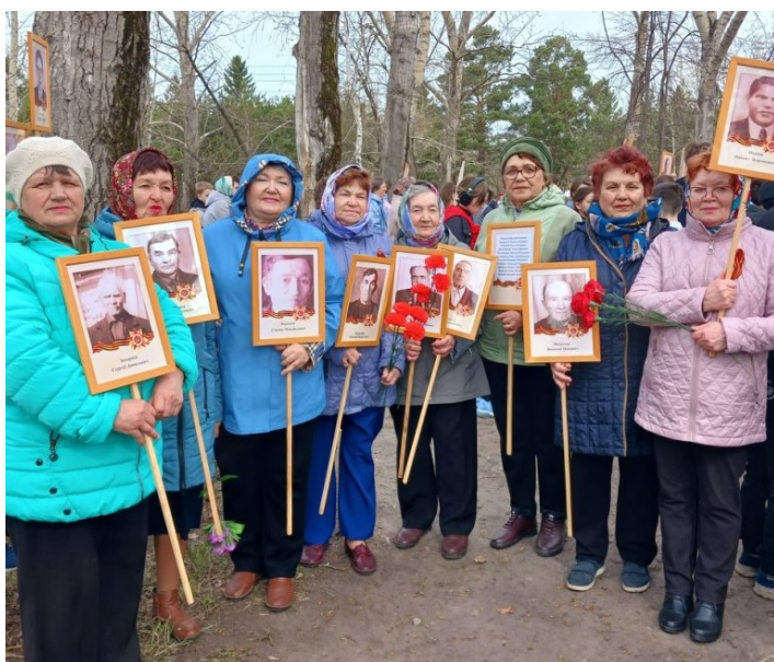
Ветераны Красноярского сельского поселения приняли участие в шествии «Бессмертный полк».