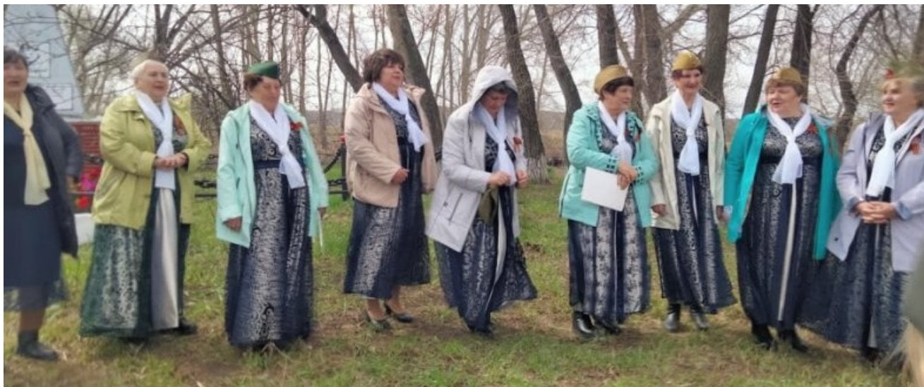
Шипицынские ветераны побывали в небольшой деревеньке Кирсановка, поздравили жителей с Днём Великой Победы.