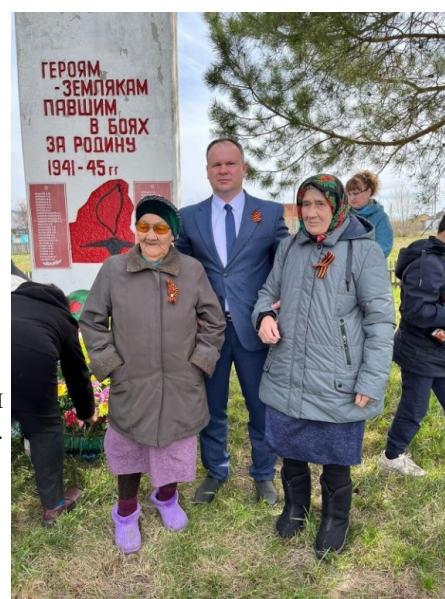
Ветераны (труженики тыла) Новологиновского сельского поселения у памятника.